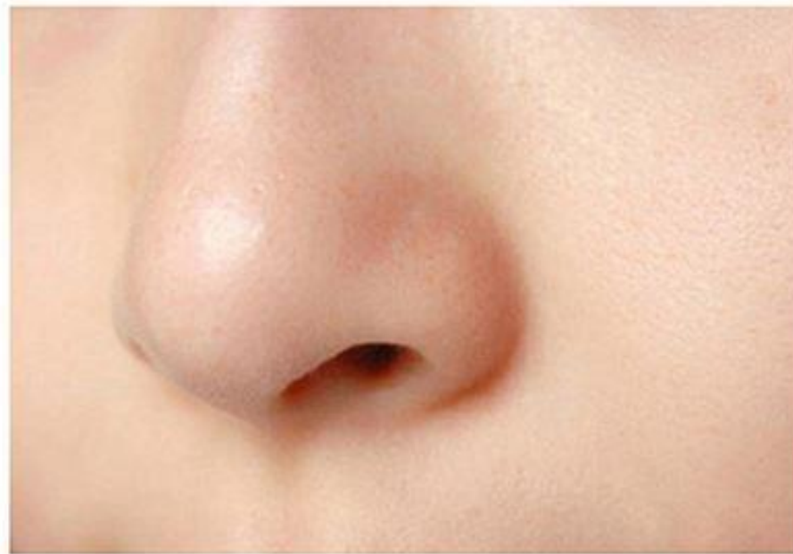
黑头减少，肌肤清爽细腻