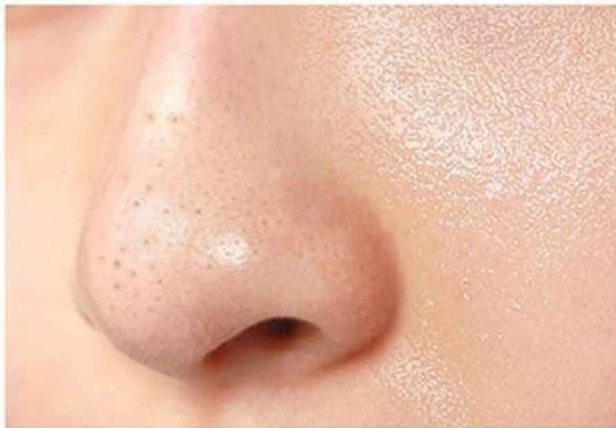
黑头繁多、油脂旺盛、毛孔粗糙问题